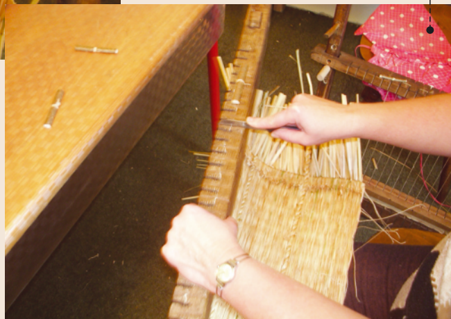
SKIDANJE S PRIJEME