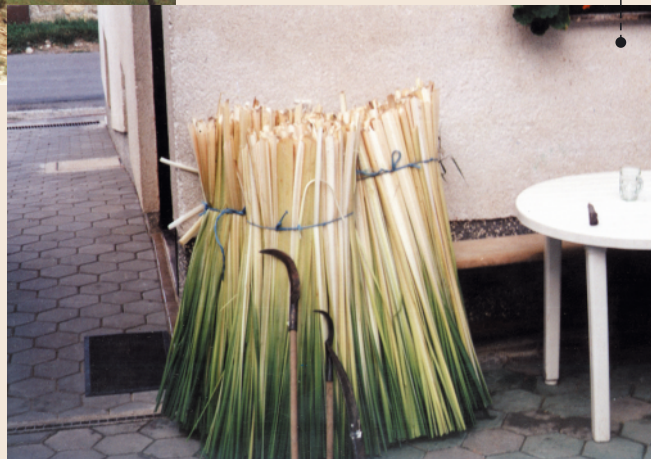
MATERIJAL I PRIBOR - rogoz i srpačice