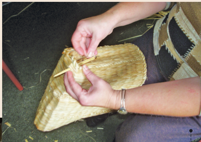
ŠIVANJE SPLETENOG LOGOŽARA - TAŠKE