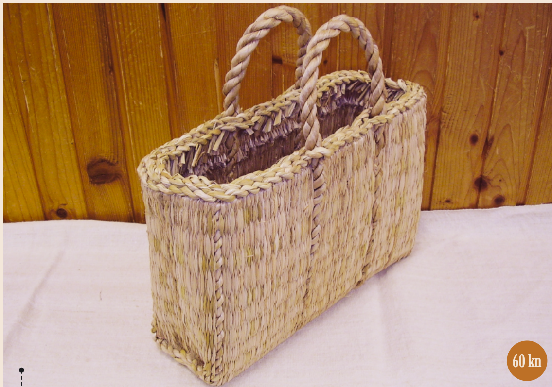
LOGOŽAR TAŠKA - opleteni, 26 dretica, širina 4 dretice