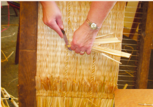
OBREZIVANJE SPLETENOG LOGOŽARA - prije skidanja s prijeme