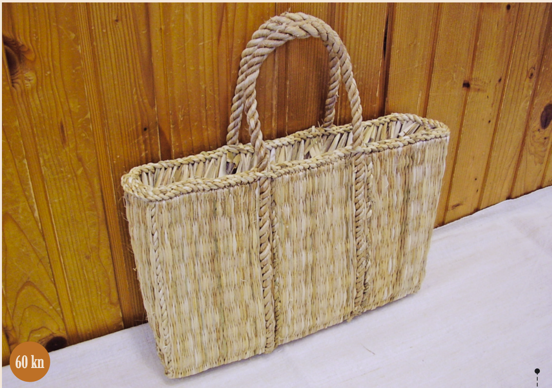
LOGOŽAR TAŠKA - opleteni, 26 dretica, širina 2 dretice