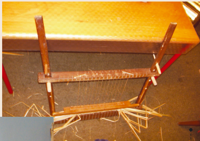
PRIJEMA - za izradu logožara