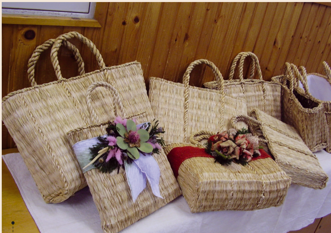
LOGOŽARI - ukrašeni